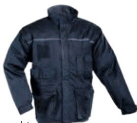
40 tmavomodrá granatowy

zimní bunda s odnímatelnými rukávy samostatně nositelná zateplená vesta větruodolný a prodyšný materiál