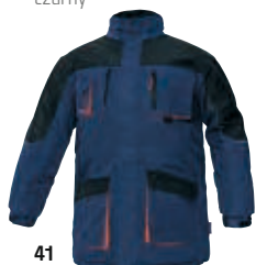
41 tmavě modrá granatowy