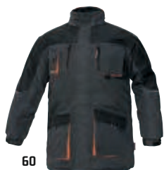
60 černá czarny