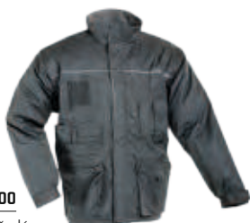
00 šedá szary