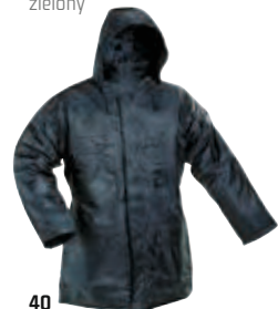
40 tmavomodrá granatowy