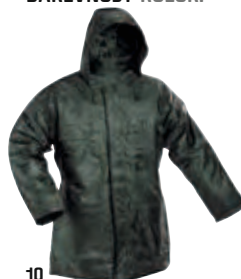
10 zelená zielony