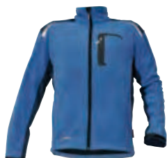
40 modrá niebieski