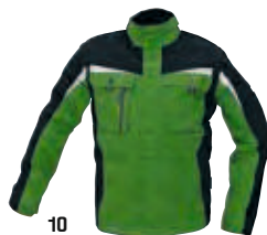
10 zelená-černá zielony-czarny