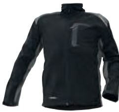
60 šedá-černá szary-czarny