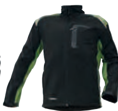
10 černá-zelená czarny-zielony