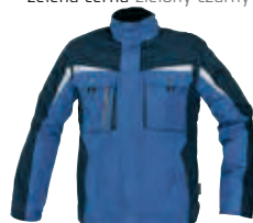
40 modrá niebieski