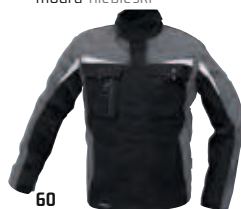
60 černá-šedá czarny-szary